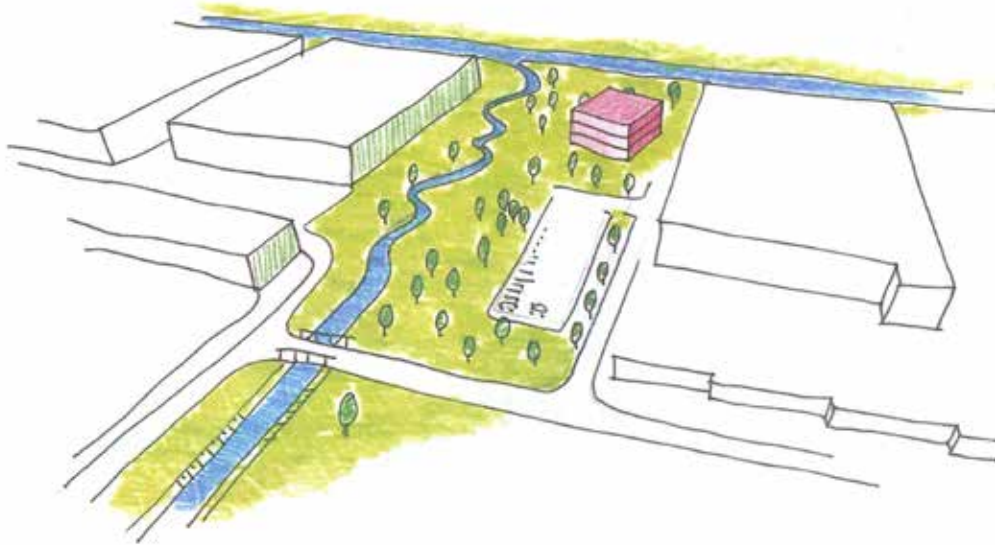
Variant 4: Open maken beek en sloop loods + kantoor en parkeerterrein

initiatiefnemer: Gemeente Gemert - Bakel en Waterschap Aa en Maas opsteller: Deltares en DLG status: Inrichtingsvoorstel, oktober 2010 kader: Water + Ruimte atelier locatie: Gemert - Bakel, Noord-Brabant contact: Oswald Lagendijk (Deltares)