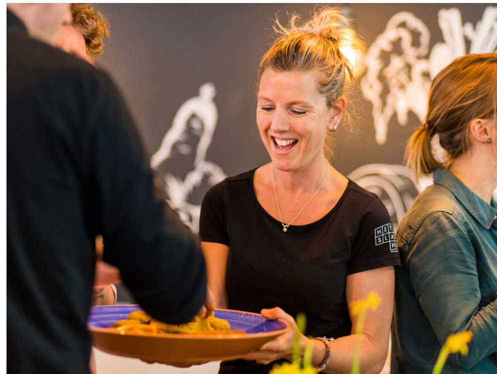
Tijdens de borrel achteraf praten de deelnemers, onder het genot van iets lekkers, nog even na over de informatieve middag.