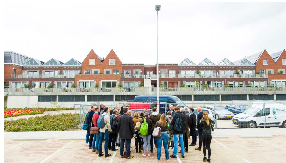
Het Lakenplein is nu nog een saai, verhard plein met weinig bomen, maar dat gaat allemaal veranderen.