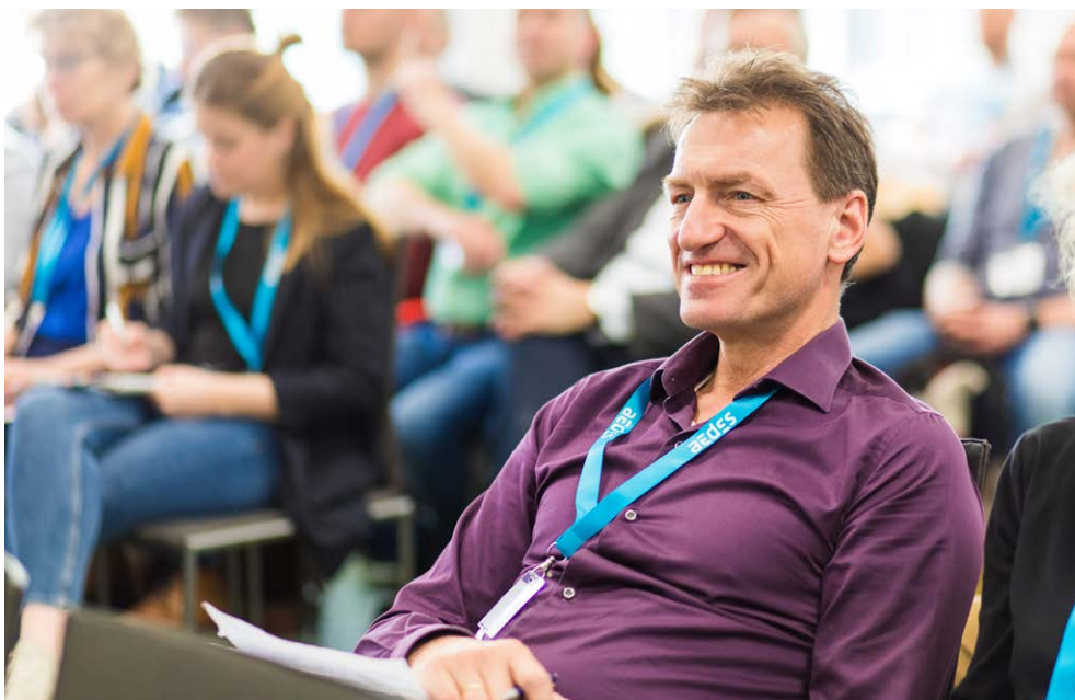
Het Lakenplein als succesvol praktijkvoorbeeld, daar word je blij van!