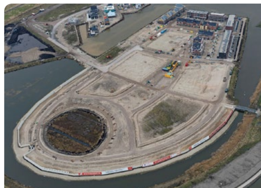
Aanleg van de woonwijk Westergouwe Gouda, een van de projecten in het Voorbeeldenboek.

Gezocht kan worden op 8 waterthema's, op problemen (technisch en organisatorisch) en op oplossingen (waarbinnen weer een groot aantal zaken geselecteerd kan worden). Daarnaast kan via de site een bezoek gepland worden aan een groot aantal oplossingen in de praktijk. Met een inlogaccount zijn de contactgegevens van de referent en betrokken partijen van projecten beschikbaar. Partijen kunnen zelf projecten inbrengen.