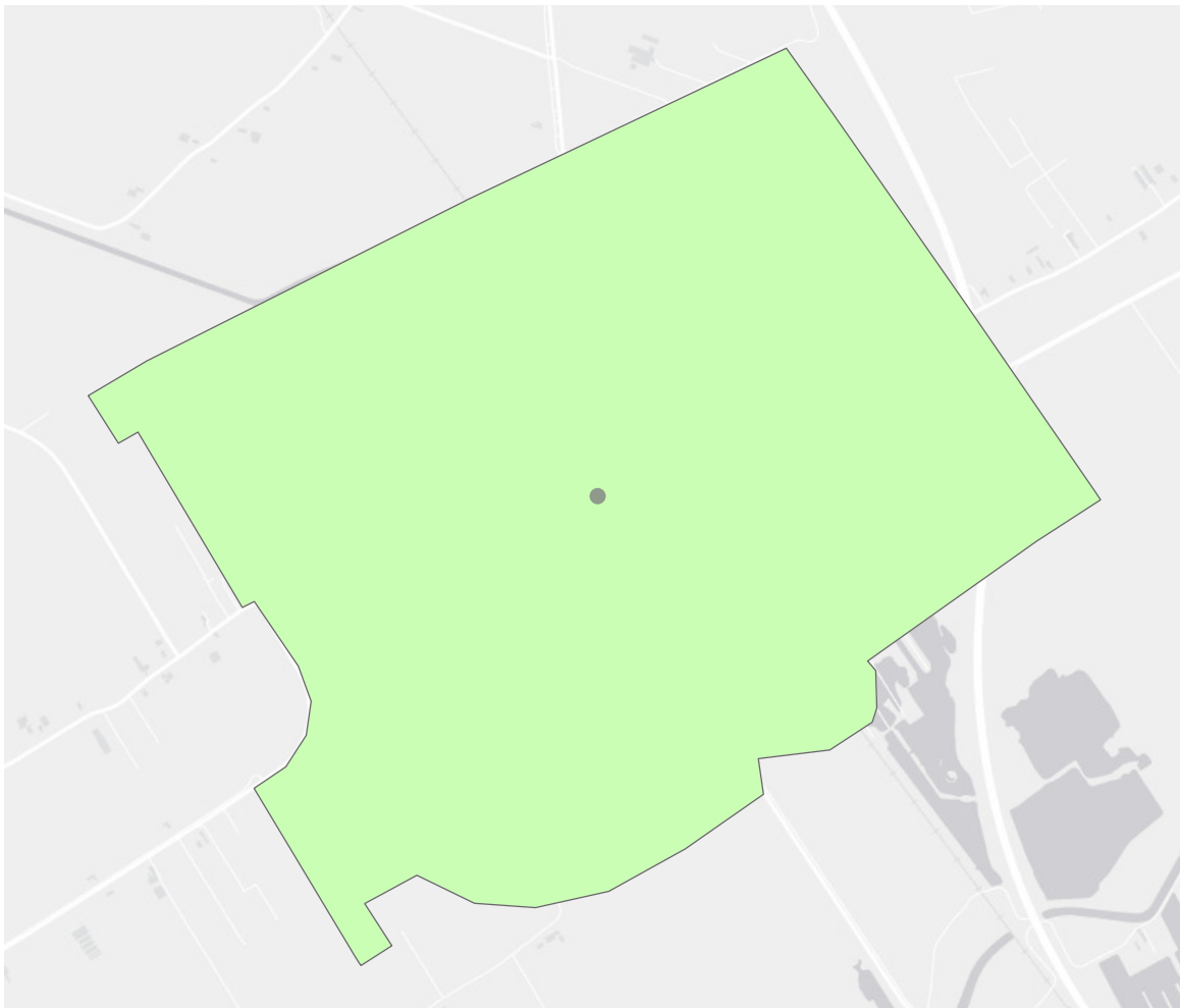
Gemiddelde gevoelstemperatuur hete zomerdag per buurt